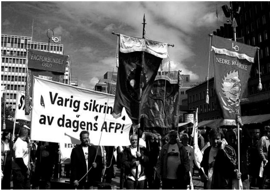
1. mai-tog i Oslo.

Regjeringa mottok Uførepensjonsutvalgets innstilling 16. mai. Rødt nytt viser i denne artikkelen hvordan uførepensjonistene får mye dårligere økonomiske kår, dersom denne går gjennom.