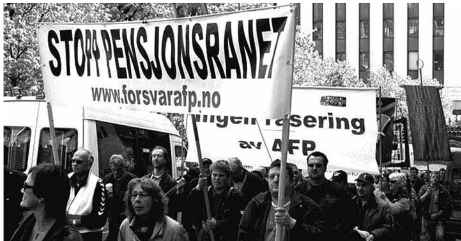
2100 streikende på Youngstorget i Oslo.

I denne situasjonen blir det avgjørende at fagbevegelsen i offentlig og privat sektor, på tvers av hovedorganisasjonene, kan stå sammen med kvinnebevegelsen, pensjonister og ungdom, mot pensjonskutt og for å forsvare både AFP og de lov- og avtalefesta pensjonsordningene for offentlig ansatte. Bare en slik allianse kan ha sjanse til å vinne.